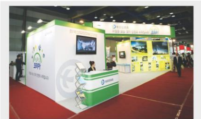
[한국산업안전보건공단 홍보관] KOSHA PR Booth