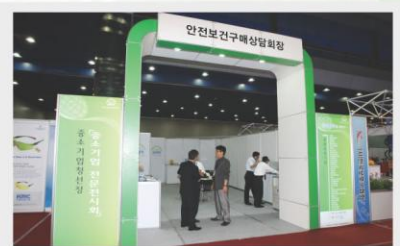
[안전보건연구매상담회] Business Trade Meeting