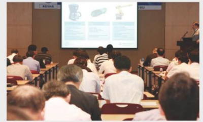
[기술세미나] Technical Seminar