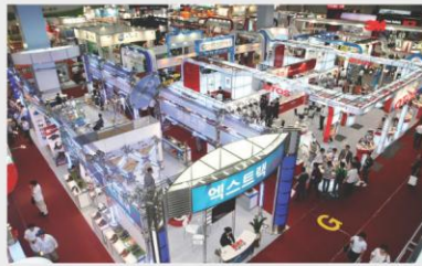
[전시장 전경] Exhibition Hall