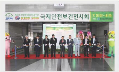
[개막식] Opening Ceremony