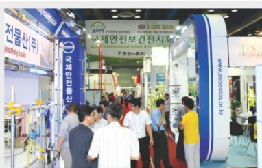
[전시장 전경] Exhibition Hall